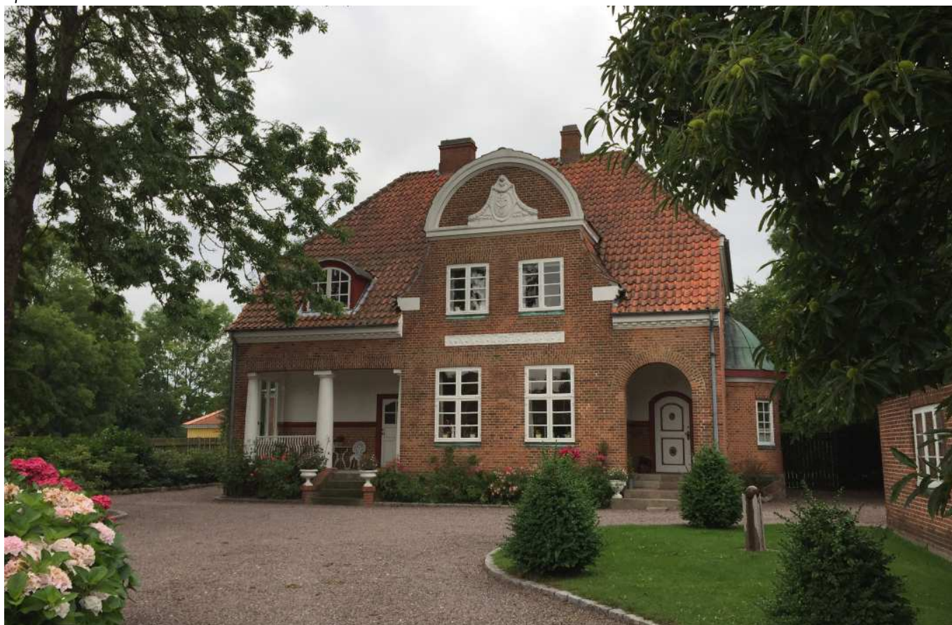
Kommunen har mange smukke gamle villaer. Her er det en villa i Ringe.