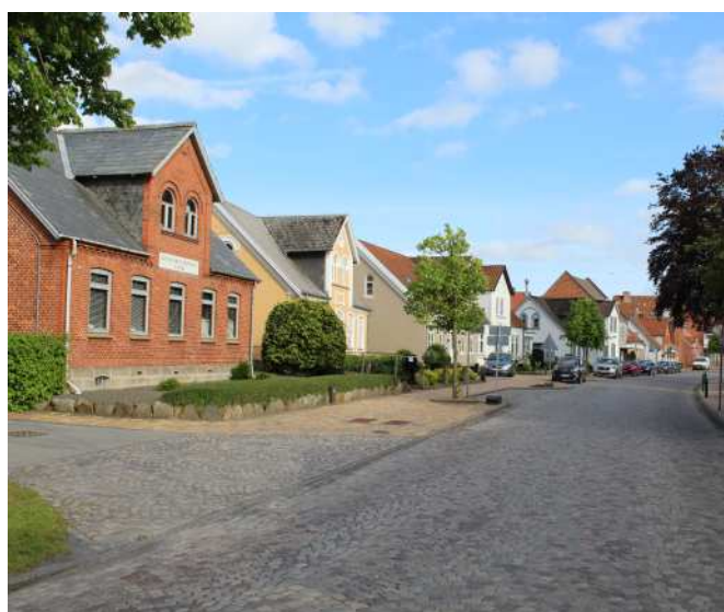
Algade i Ringe, hvor mange huse er opført i samme periode. Det giver vejforløbet en stærk identitet, trods forskellig detaljering.