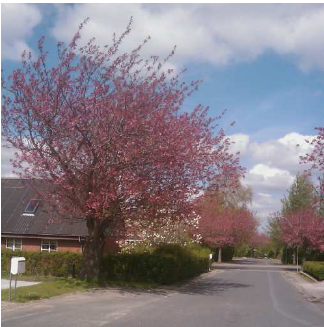
Mange steder har boligkvartererne en markant beplantning der giver identitet og genkendelighed til området. Her er brugt japansk kirsebær, der både har en smuk facon, blomstring og senere løv og efterårsløv.