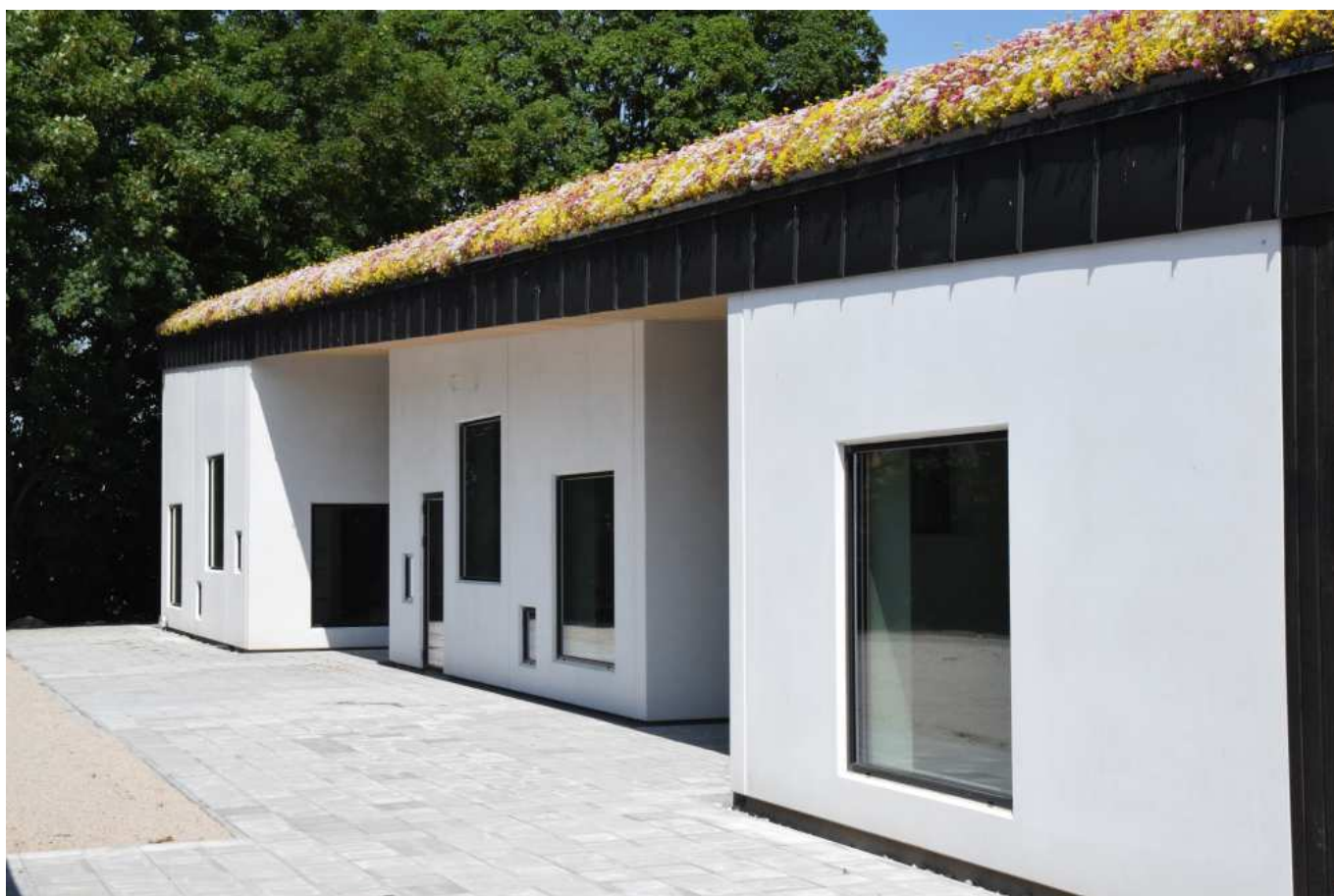
Øhavsskolen - Svanen, har fået en nybygget fløj der både har stramme linjer og leg i sit formsprog. Det er et fint eksempel på nybyggeri hvor der er opnået et godt resultat der giver noget værdi i sig selv og til sine omgivelser. Bygningen er formgivet af Arkitekt Charlotte Folke.