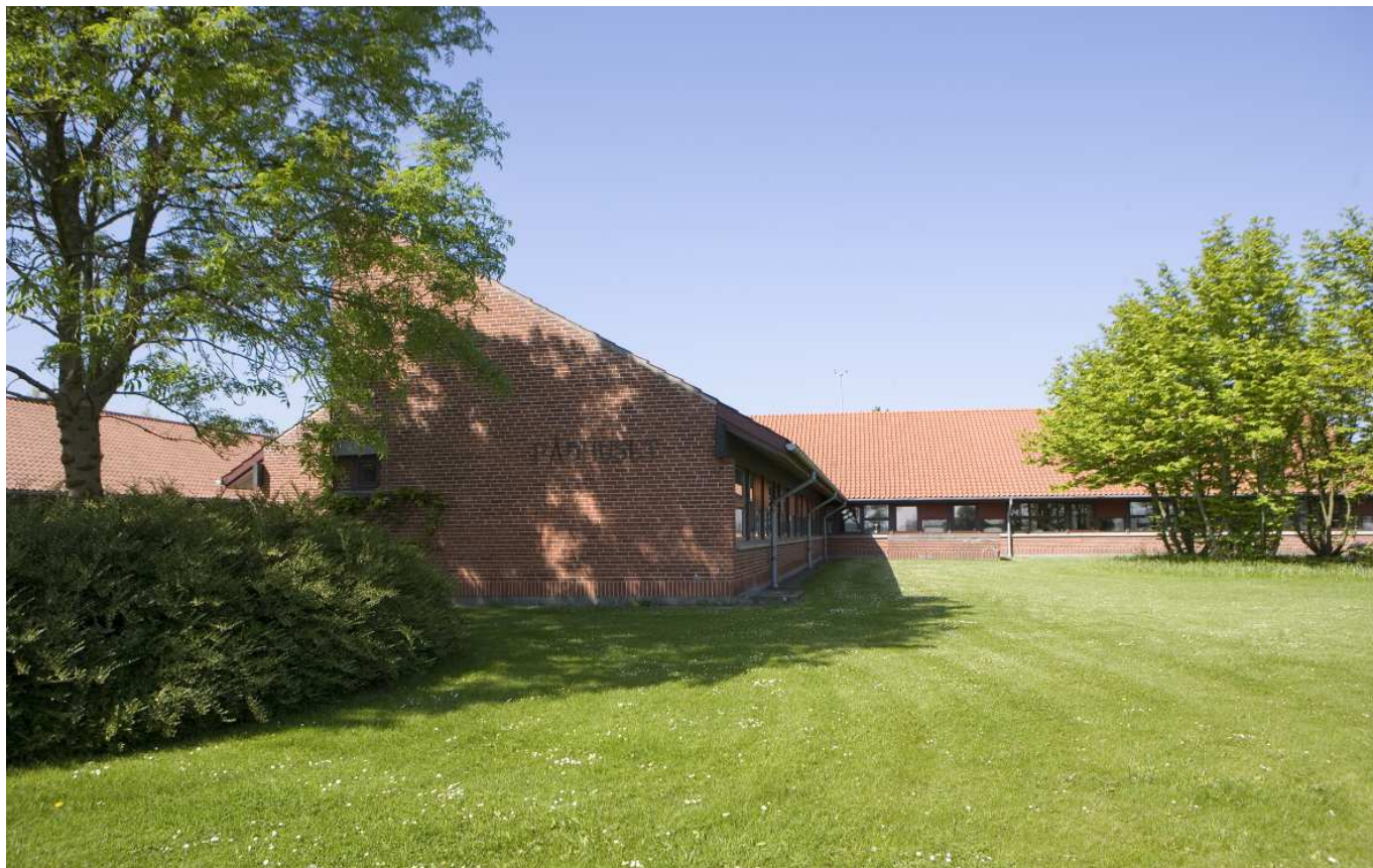
Rådhuset i Ringe. Et tidstypisk offentligt byggeri der møder sine borgere i øjenhøjde, men samtidigt er et markant ikon i sine smukke grønne omgivelser.