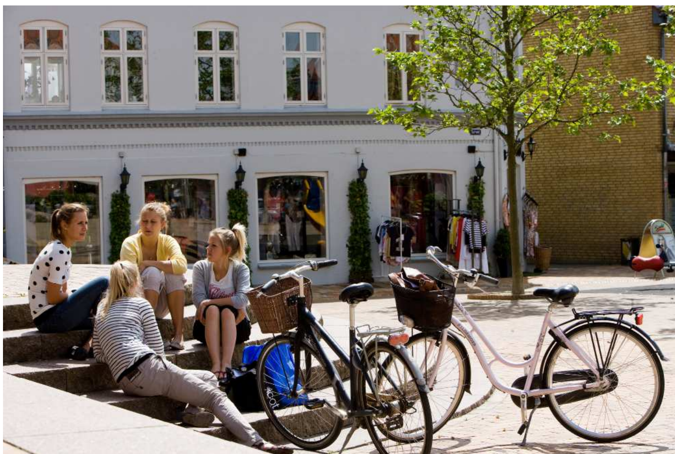
I Ringe er der byrum, der indbyder til uformelt opholdt - det er særligt attraktivt på en sommerdag. Men måske kan det udvides til at være attraktivt i meget længere perioder, hvis der arbejdes med udformningen?