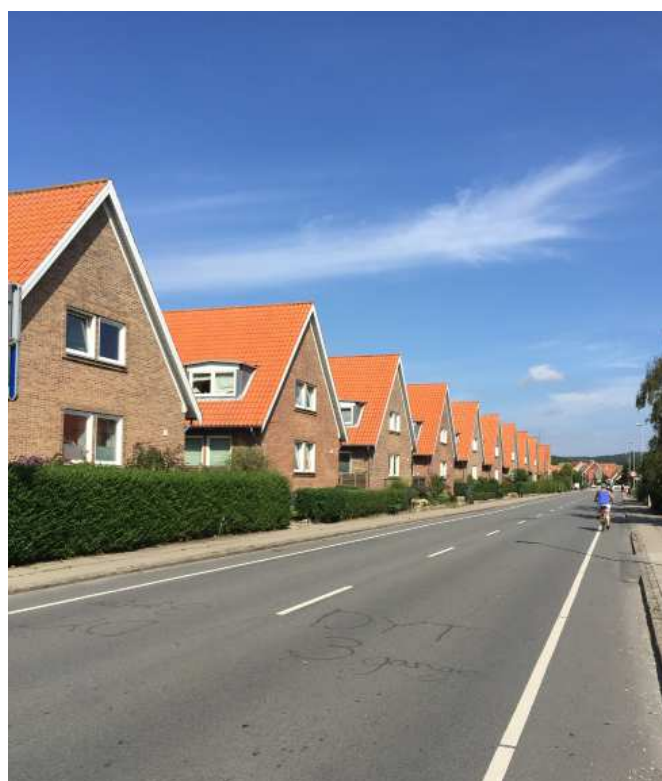
Engvej i Faaborg, er præget af det rytmiske boligforeningsbyggeri. Vinduesformaterne er skiftet og der er tilføjet tagudhæng, der ikke passer til stilen, men indtrykket er stadig karakterfuldt, på lang afstand.