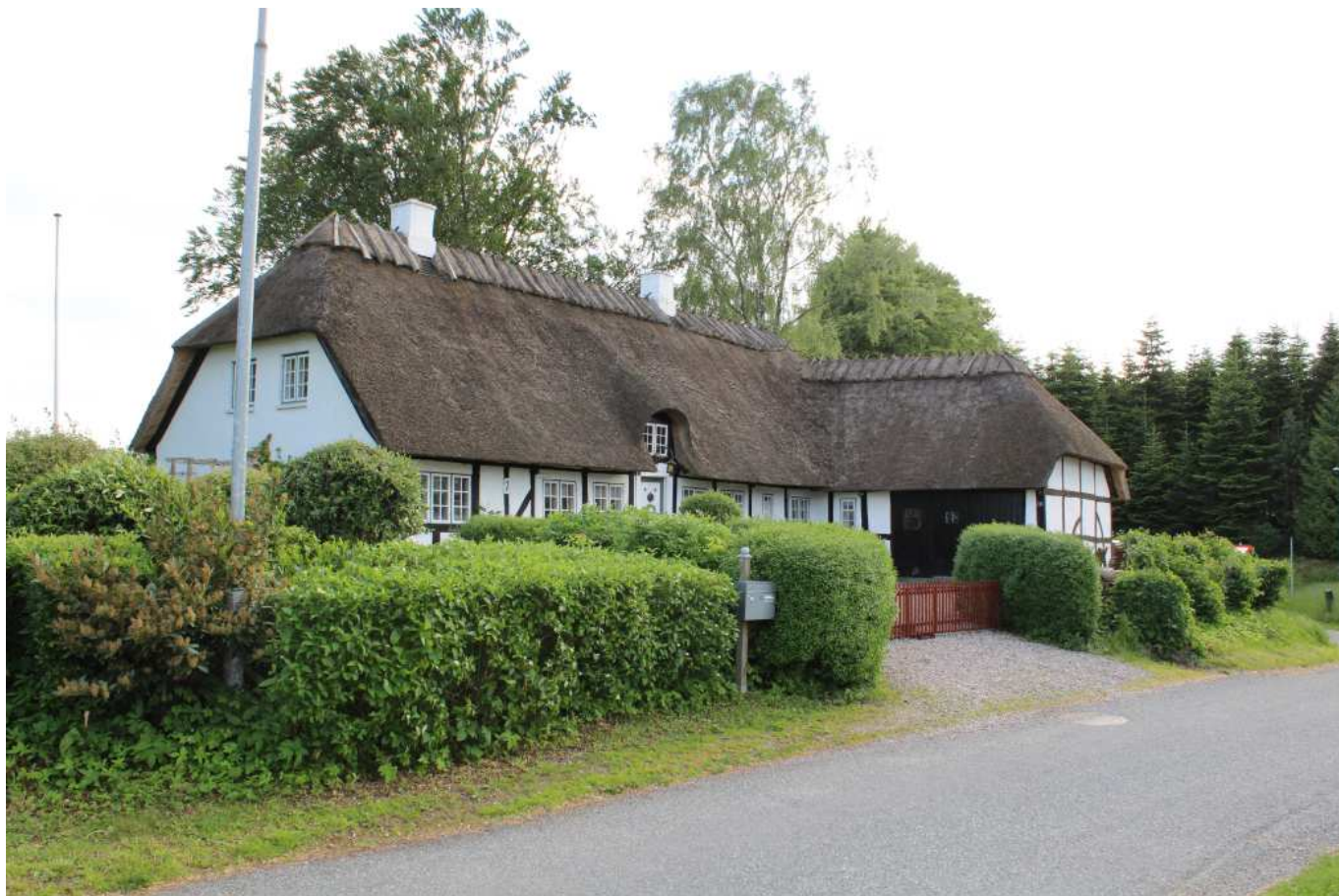
Den gamle smedje i Lørup, en af kommunens mange smukke og velholdte gamle ejendomme, som bidrager til den positive fortælling om landsbyerne.