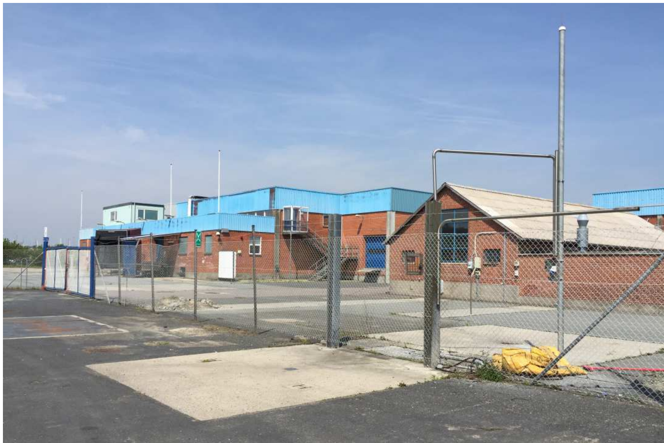
Slagterigrunden i Faaborg ligger midt i havnens liv. Slagteriet er lukket og skal omdannes til nye formål, som understøtter byens og havnens liv. Med en så central placering er der mange muligheder og udfordringer.