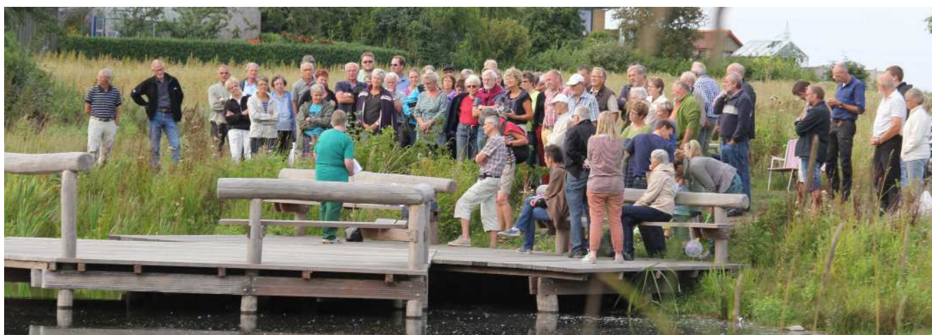
Indvielse ved søen i Kværndrupps Bypark. Her giver platformen adgang til vandet. Nu kan skolen bruge søen til undervisning, og byen har fået et nyt rekreativt rum, som før var utilgængeligt.