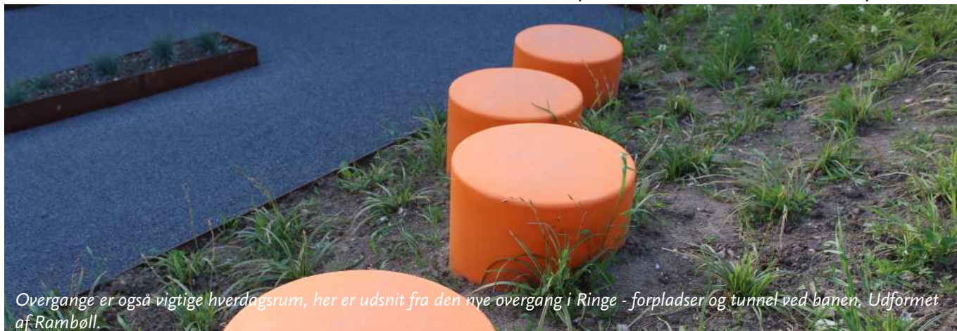
Overgange er også vigtige hverdagsrum, her er udsnit fra den nye overgang i Ringe - forpladser og tunnel ved banen. Udformet af Rambøll.

Byrum der inspirerer og appellerer til sociale aktiviteter i form af ophold, bevægelse og samvær efterspørges i stigende omfang af borgere. Det skal ses i lyset af, at der generelt er en tendens til, at borgere vil bevæge og opholde sig mere ude, både alene og i fællesskab med andre. Derfor lægger borgerne større vægt på, at kunne bruge de offentlige rum til flere forskellige typer ophold og aktiviteter end tidligere og gerne hele året. Indretningen af byens rum og de forskellige typer af socialt liv de appellerer til, bliver derfor i stigende grad afgørende for oplevelsen af byers attraktivitet som et sted at bo, drive virksomhed eller holde ferie. Derfor skal vi i højere grad og i fællesskab arbejde for at sikre kvaliteten i vores byrum.