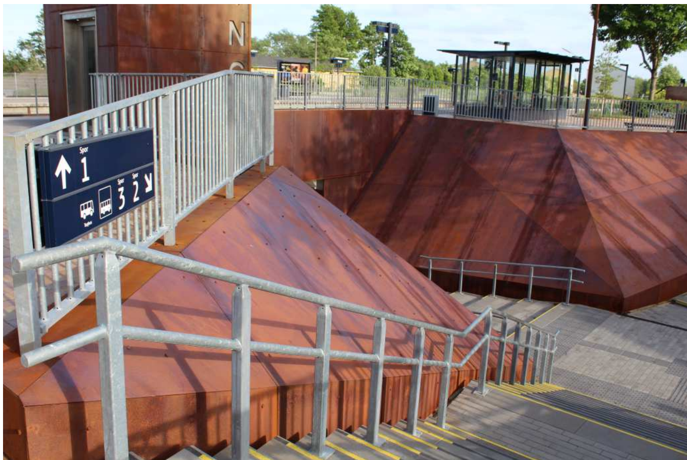
De nye forpladser ved station og jernstøberigrund i Ringe, gør ankomsten til Ringe til en særlig oplevelse. Materialerne refererer tilbage til områdets industrihistorie og giver en stærk identitet til området.