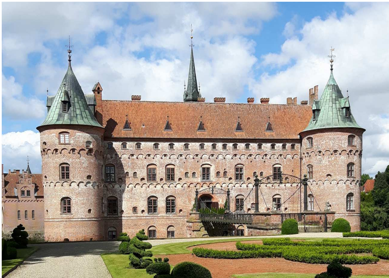
Egeskov slot er det bygningsværk i kommunen der har den stærkeste nationale identitets- og attraktionsværdi. Her udnyttes potentialet til at skabe en helt unik turistattraktion.