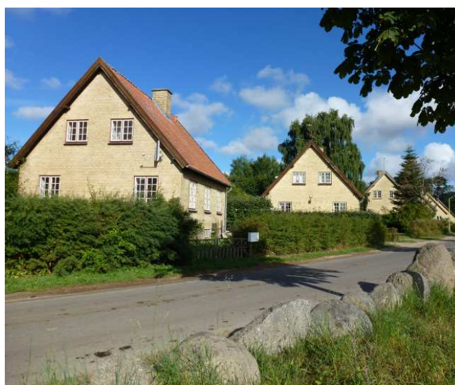
Søvej v. Søbysøgaard. Her ligger de tidligere fængselsfunktionærboliger som perler på en snor langs søen.