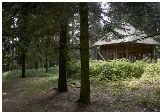
Skovshelteret i Dyreborg Skov. Arkitekturen giver mindelser om det tidligere foderhus, der lå på samme placering. Her har man en unik mulighed for at ligge en etage over terræn og kigge ud i skoven.