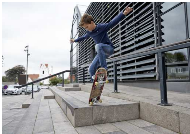
Ved biblioteket i Ringe, giver trappen mulighed for både aktivitet og ophold.

En bygning skal være generøs. Den skal give mere, end den tager. Den skal deltage i byens liv og forære noget væk helt gratis.