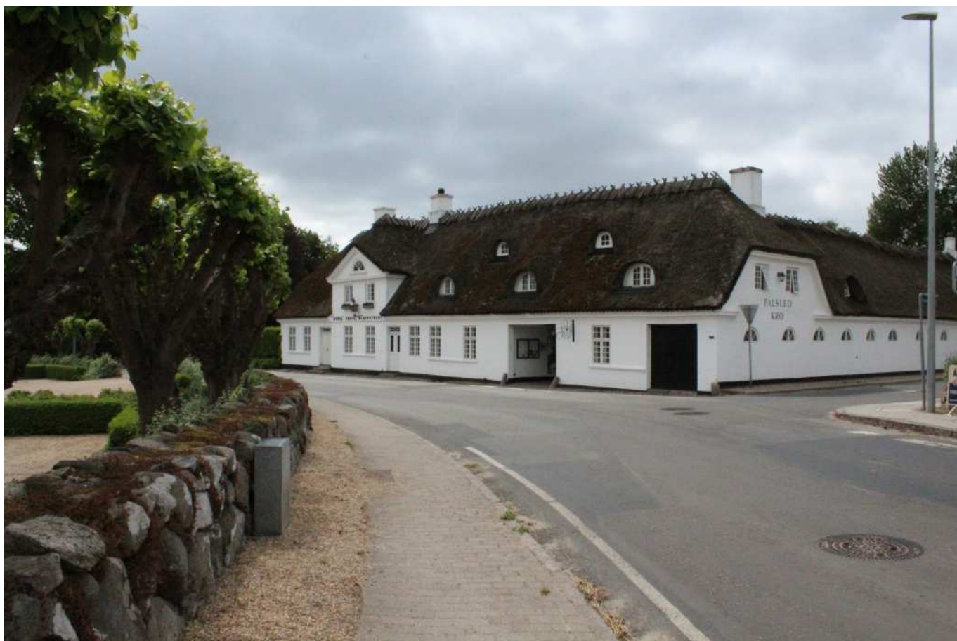
Faldsled kro ligger i hjertet af det ældste Faldsled. Det er måske kommunens mest kendte fredede bygning. Kroen er et bærende element af det samlede landsbymiljø.