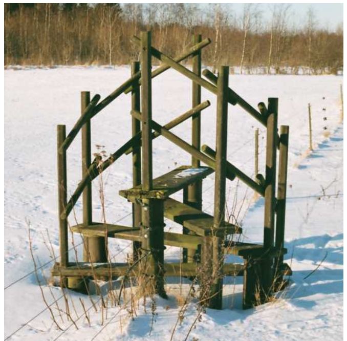
Naturområdet Tarup Davinde indeholder en mangfoldighed af både natur- og kulturoplevelser. Her er det en stente, der er smukt udformet og fremstår som en arkitektonisk skulptur.