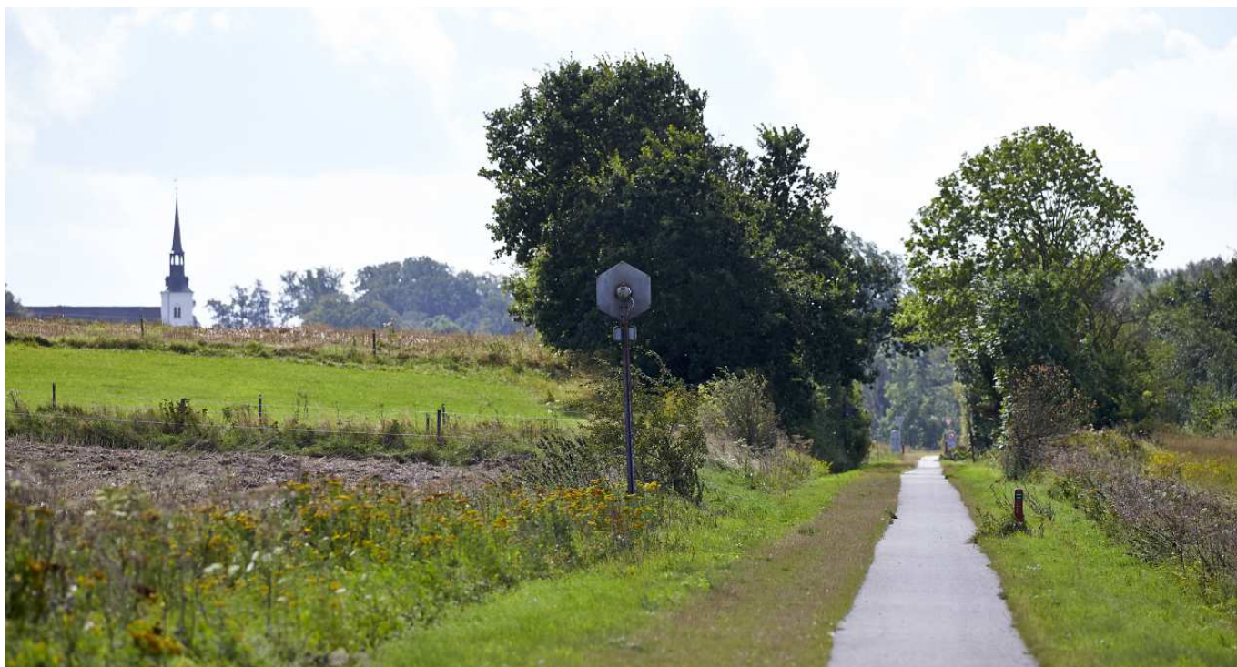
Naturstien Korinth-Ringe løber på den gamle banestrækning. Det er en landskabeligt smuk tur med mulighed for ophold ved de gamle stationer.