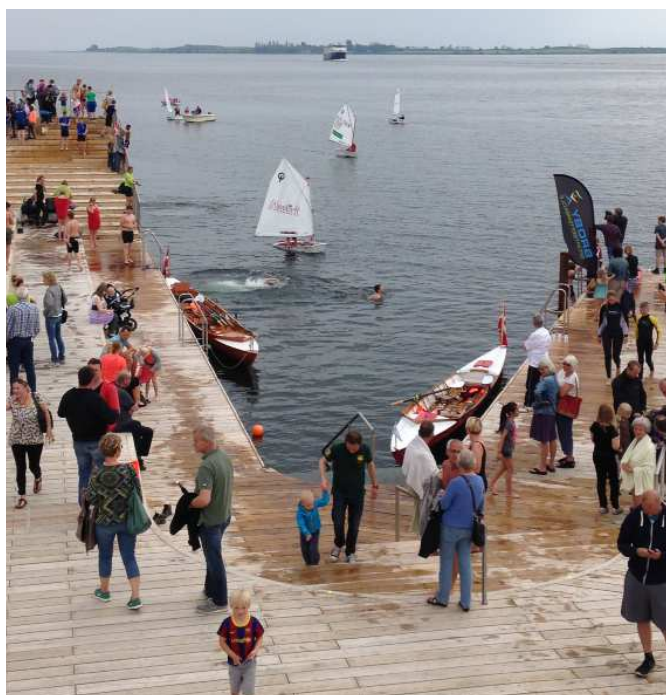
Havnebadet i Faaborg danner rammen om mange vandrelaterede funktioner. Her har et offentligt byggeri bidraget til helt nyt og værdifuldt byliv, hvor vandets aktiviteter trækkes med ind i byens liv.