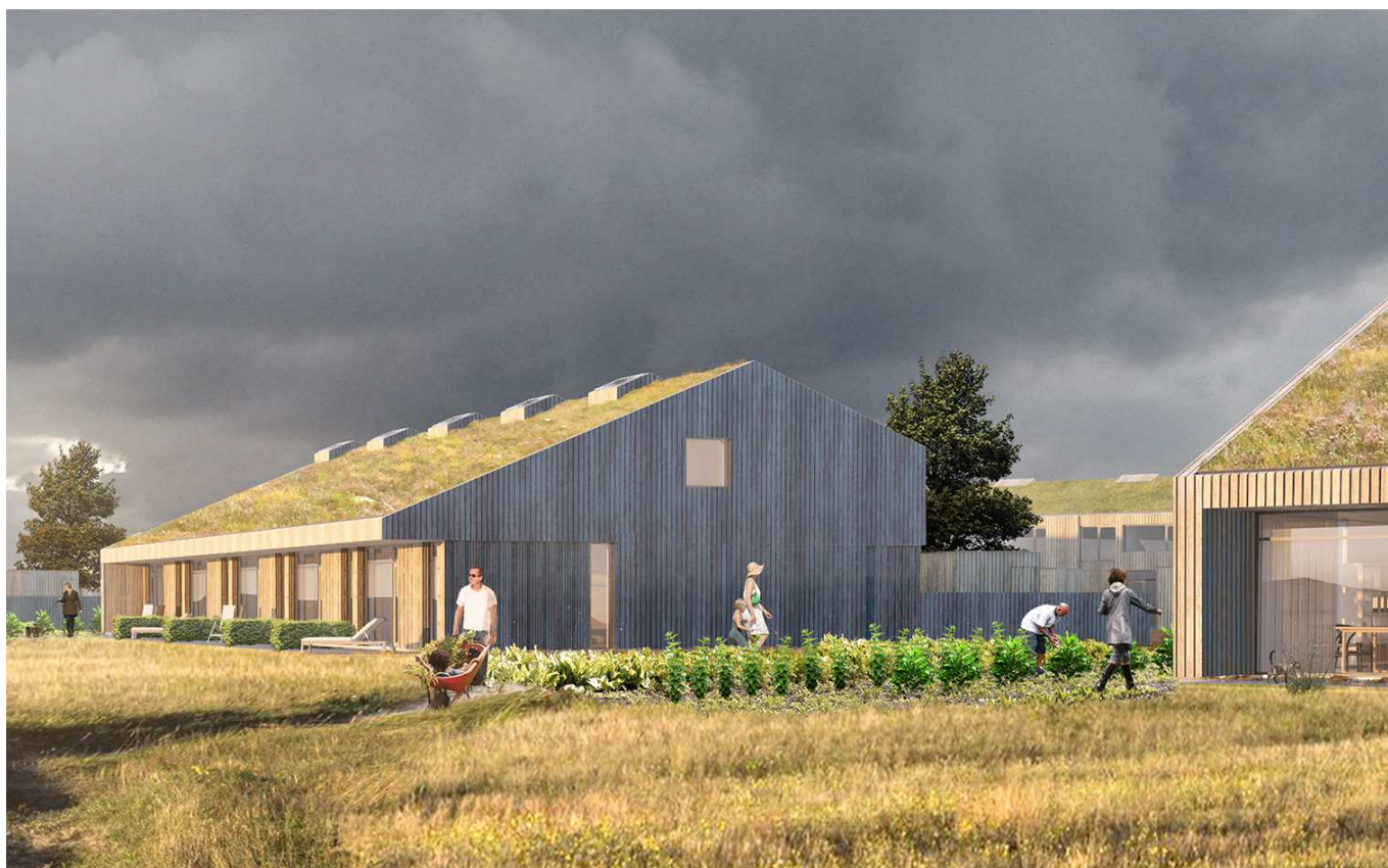
På Lensvej i Årslev opfører boligforeningen CIVICA nye boliger med en grøn profil, der har fokus på bæredygtighed og fællesskaber. Arkitekturen afspejler sin tid i form, indretning og materialevalg. Projektet er udformet af KPF Arkitekter. (illustration: KPF arkitekter)