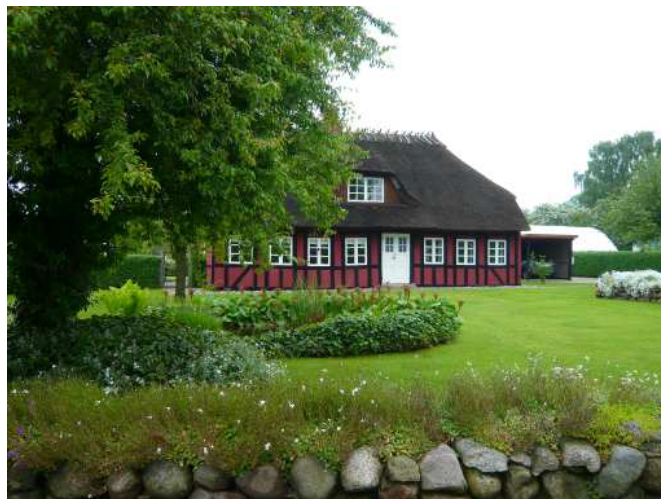
Gl. Allested. Det velbevarede landsbymiljø giver landsbyen en stærk og genkendelig identitet.