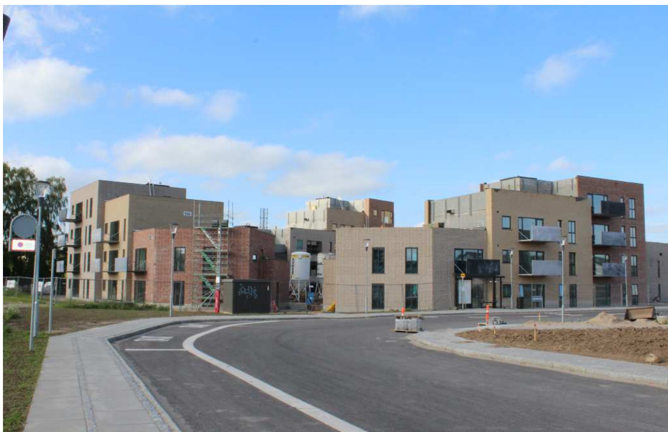
Jernstøberigrunden i Ringe er under omdannelse. Her lå tidligere store knopskudte industribygninger i mangeartede materialer. Nu opføres almene boliger, som i deres formsprog og materialesætning trækker tråde tilbage til stedets historie. Projektet er udformet af Archidea Arkitekter for FAB.