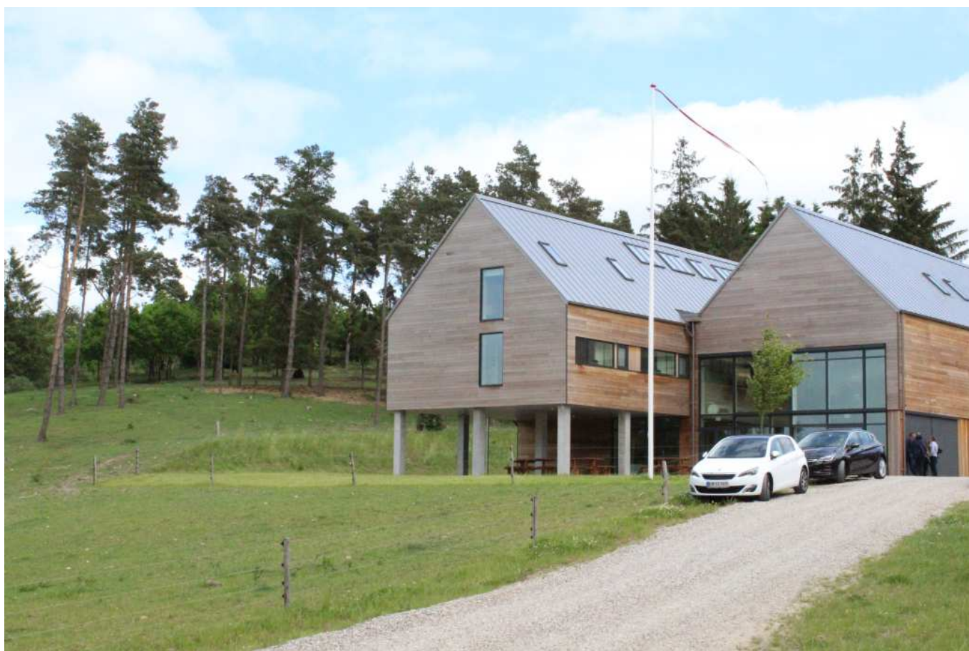
Forskningsstationen i Svanninge Bjerge putter sig elegant ind i landskabet, trods byggeriets højde kommer det aldrig over de omgivende bakketoppe.