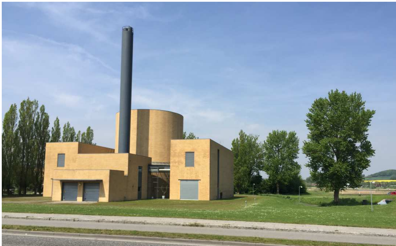
Kraftvarmeværket i Faaborg. Et ikonisk byggeri der er resultatet af en arkitektkonkurrence der blev vundet af Lundgaard & Tranberg Arkitekter.