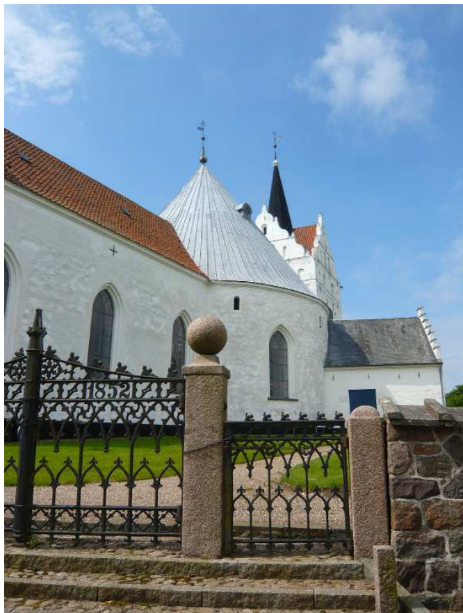
Kirkerne står mange steder som ikoner for det landskab de ligger i. Her er det Horne kirke.