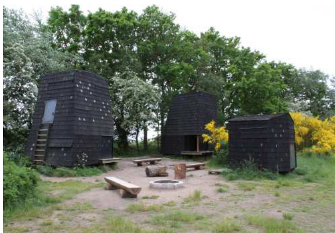
De nye shelters og pavilloner rundt omkring i vores værdifulde natur, bidrager med en ikonisk arkitektur, der giver høj genkendelseværdi. Her er det shelters ved Millinge Klint.