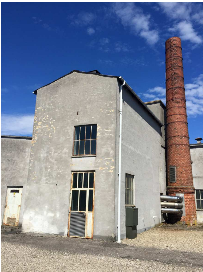
Fabers Fabrikker i Ryslinge er under omdannelse og finder et nyt liv og nye funktioner i de gamle fabriksbygninger. Her er både erhverv og frivillige projekter i spil.