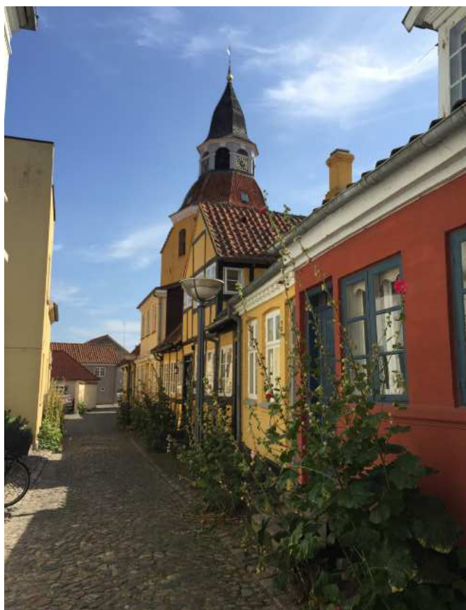
De finuarlige gamle gadeforløb i Faaborg er stærkt identitetsskabende og har en stor attraktionsværdi. Her er det Tårnstræde, med klokketårnet for enden.