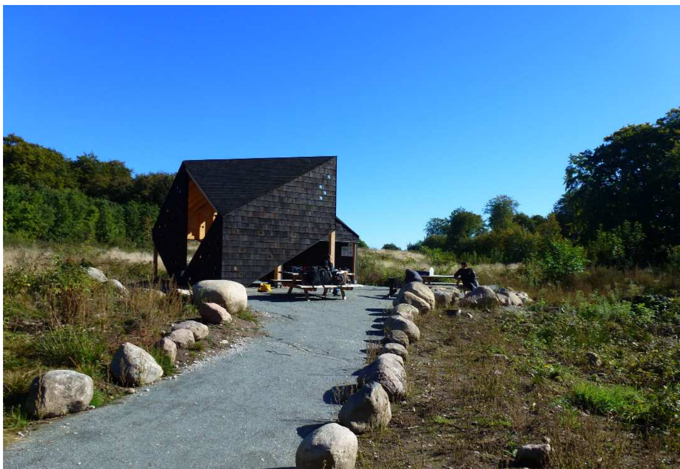
Pavillionen i Pipstorn Skov er et ikon i naturen. Det giver mulighed for en hel ny type ophold, udeskole og aktivitet i skoven.