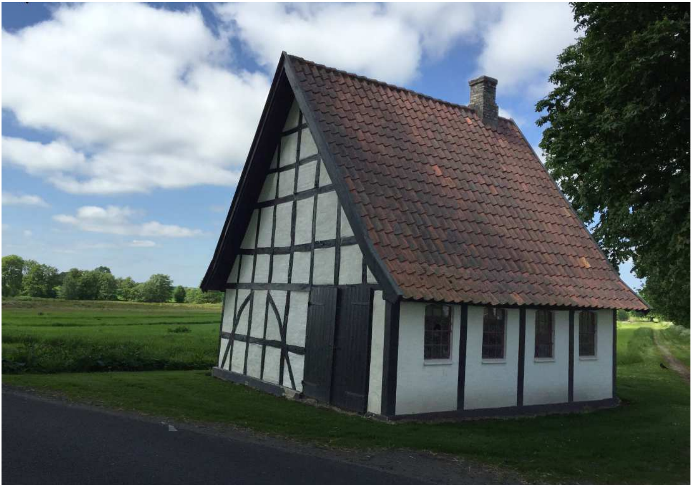
Den gamle smedie ved Boltinggaard Gods. Smedier var førhen som benzinstationer er i dag, og lå ud til landevejene, så man let kunne få omskoet en hest eller repareret sin vogn. Der er ikke mange tilbage i landskabet, men de få der er fortæller en værdifuld historie.