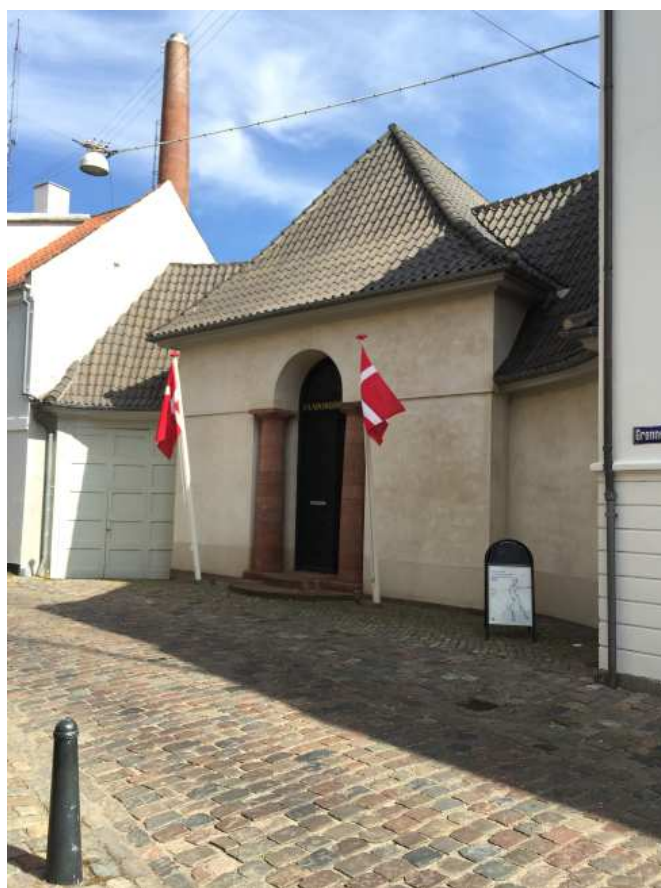
Faaborg Museum er et af landets smukkeste kunstmuseer. Facaden er stilfærdigt statelig og smuk, de indre rum gemmer en stor variation af rumoplevelser i både form, skala, farve, lys og udsmykning.