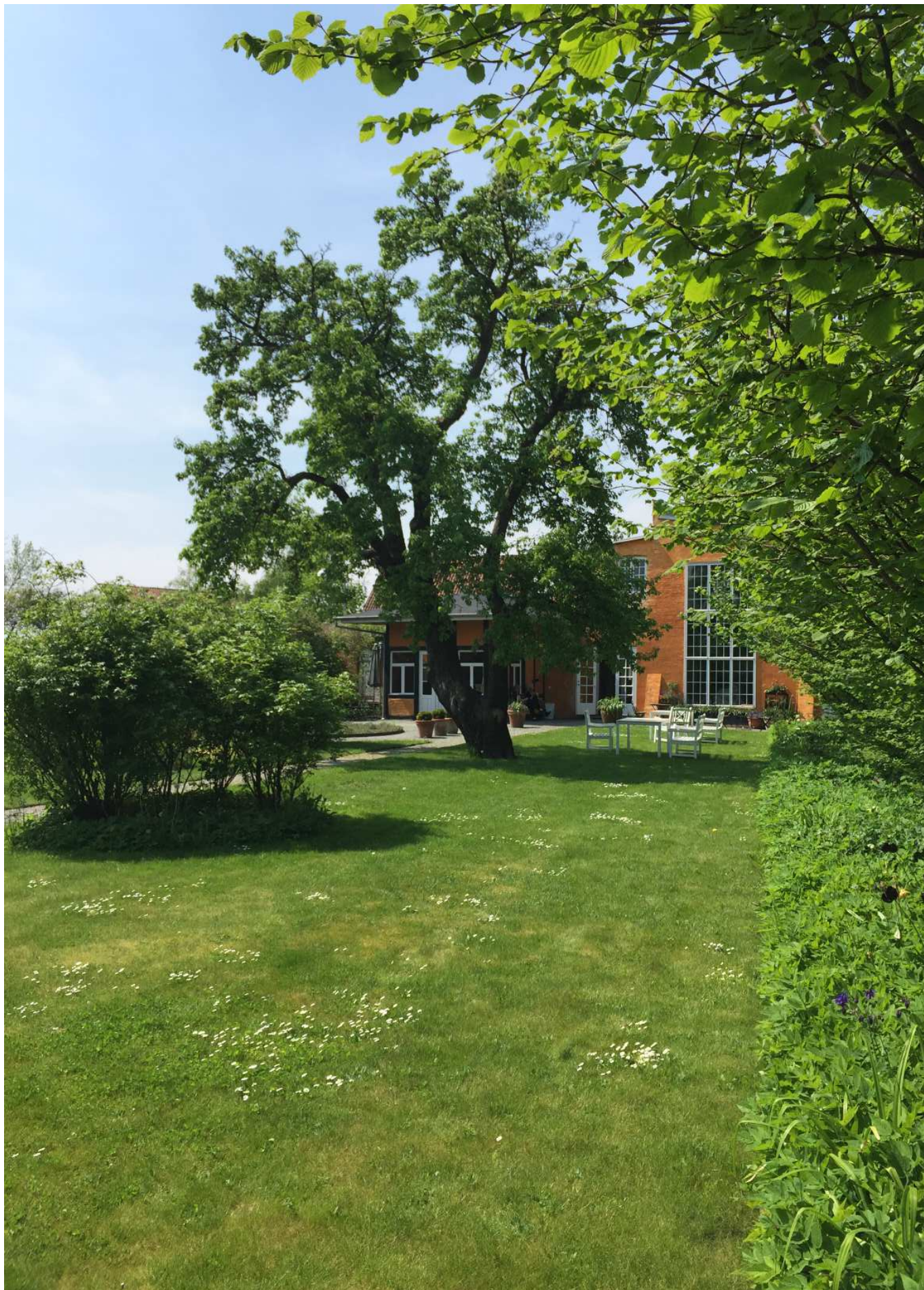
Faaborg Museums have. En 'hemmelig' have i byen, der føles som en stille tidslomme indrammet af beplantning og museets varierende facade mod haven.