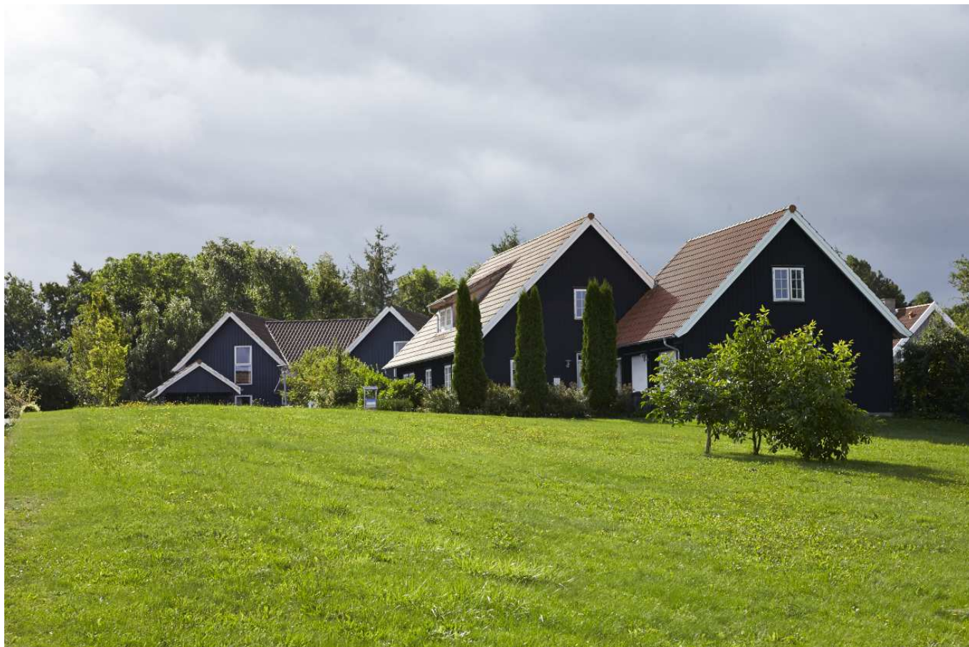
Dybdalgård i Ringe er et indbydende nyere boligområde, der har en genkendelig identitet i kraft af områdets overvejende grønne karakter.