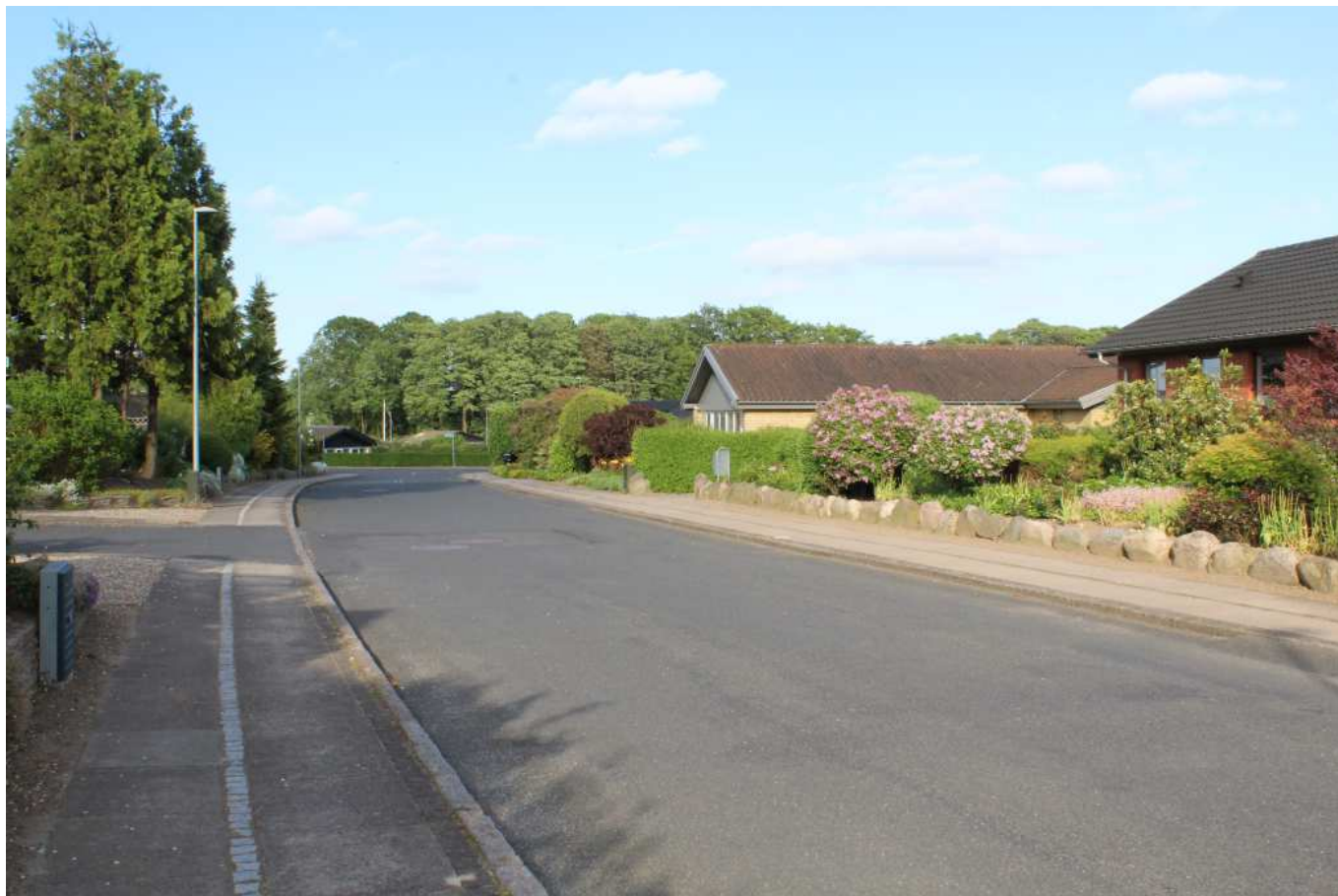
Krokusvej i Ringe. Som mange andre ældre boligkvarterene er indtrykket overvejende grønt, de mange træer og blomstrende forhave giver et indbydende og varieret indtryk. Trods forskelligheder husene imellem, er der sammenhæng i taghældning, højder og størrelser så udtrykket er varieret men harmonisk.