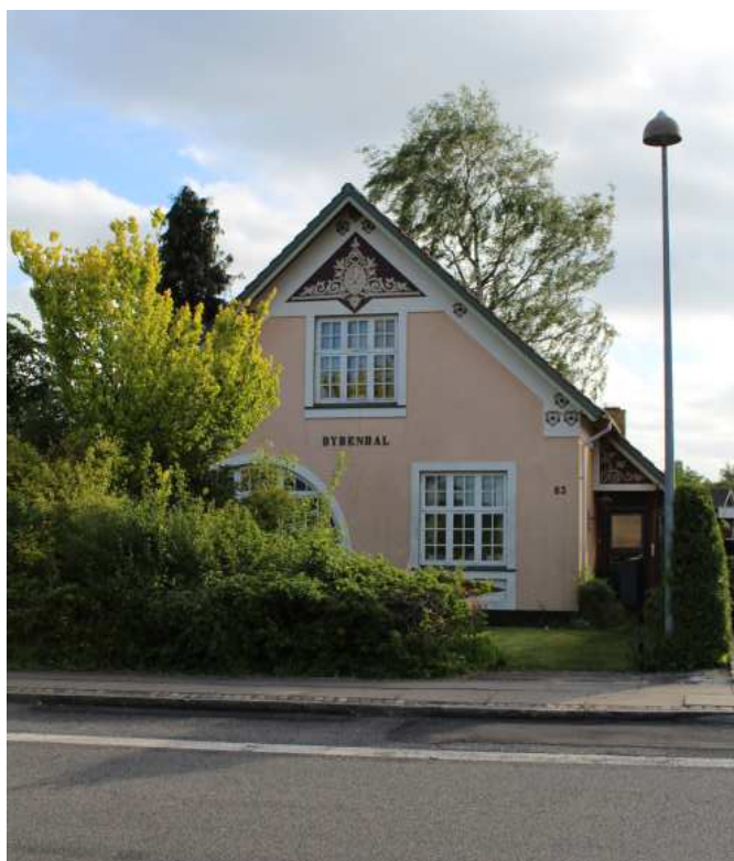
Svendborgvej i Ringe. Nogle boligområder er udviklet over meget lang tid og har store forskelligheder, her er det typisk placering og beplantning der skaber sammenhængen. Ofte er husene placeret i nogenlunde samme facadelinje mod vejen og har grønne forhaven. Her er en smuk nationalromantisk villa.