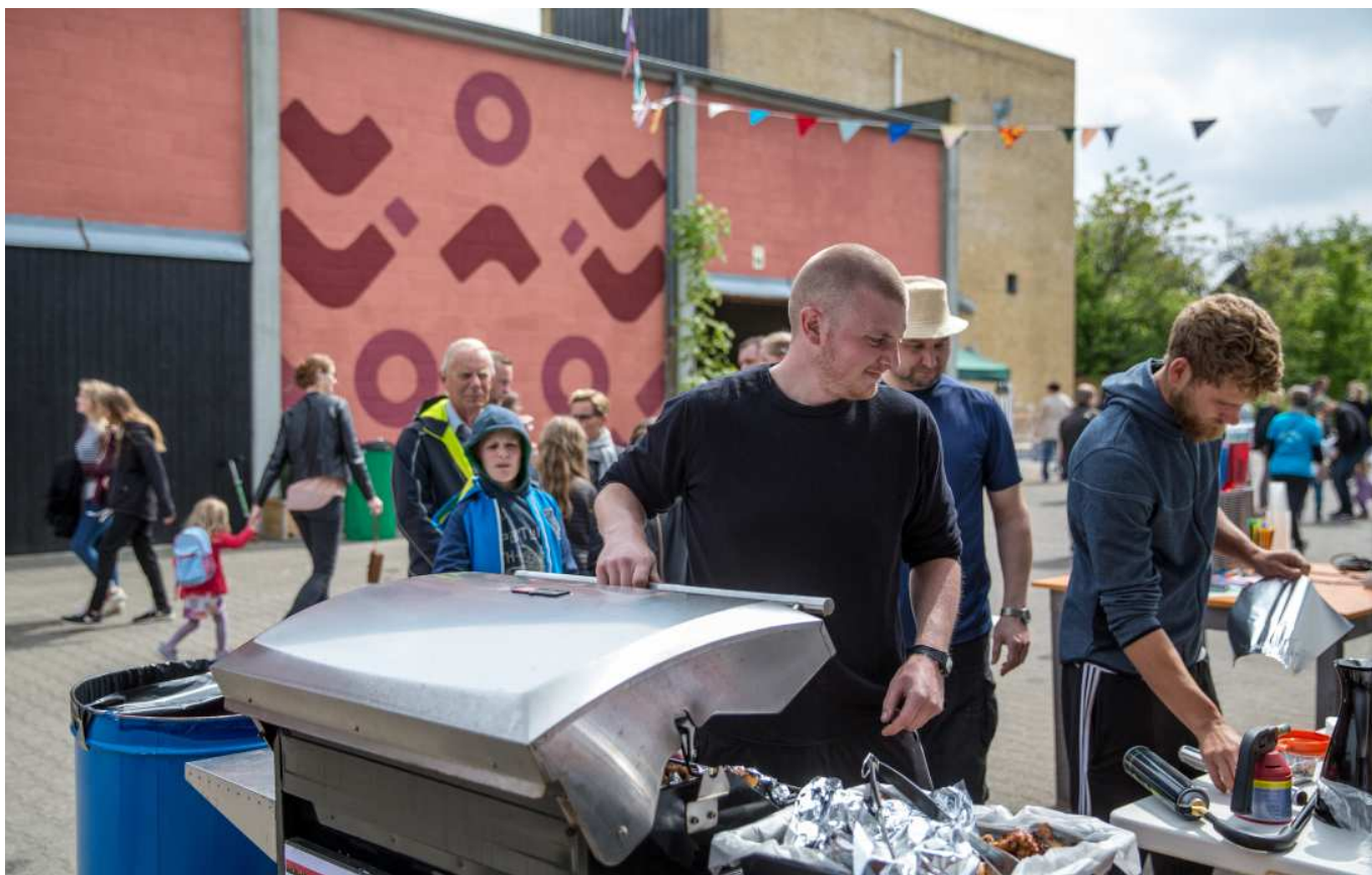
Den gamle polymerefabrik i Årslev-Sdr. Nærå er under omdannelse, i mellemtiden bliver dens inde- og uderum brugt til alle mulige slags fester, aktiviteter, møder, uddannelse og sport.