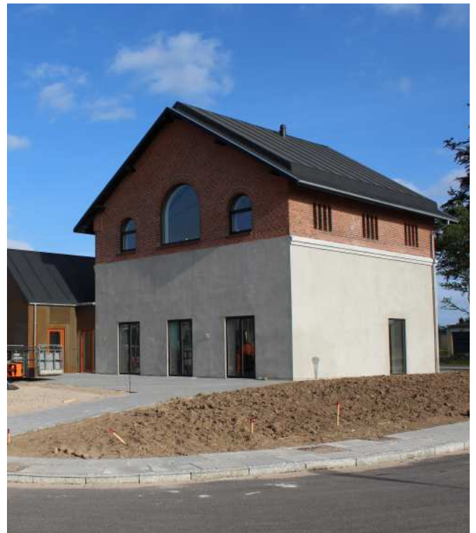
Det gamle gasværk i Ringe er omdannet til fælleshus for de nye almene boliger på Jernstøberigrunden. Bygningens hovedtræk er bevaret trods omdannelsen.