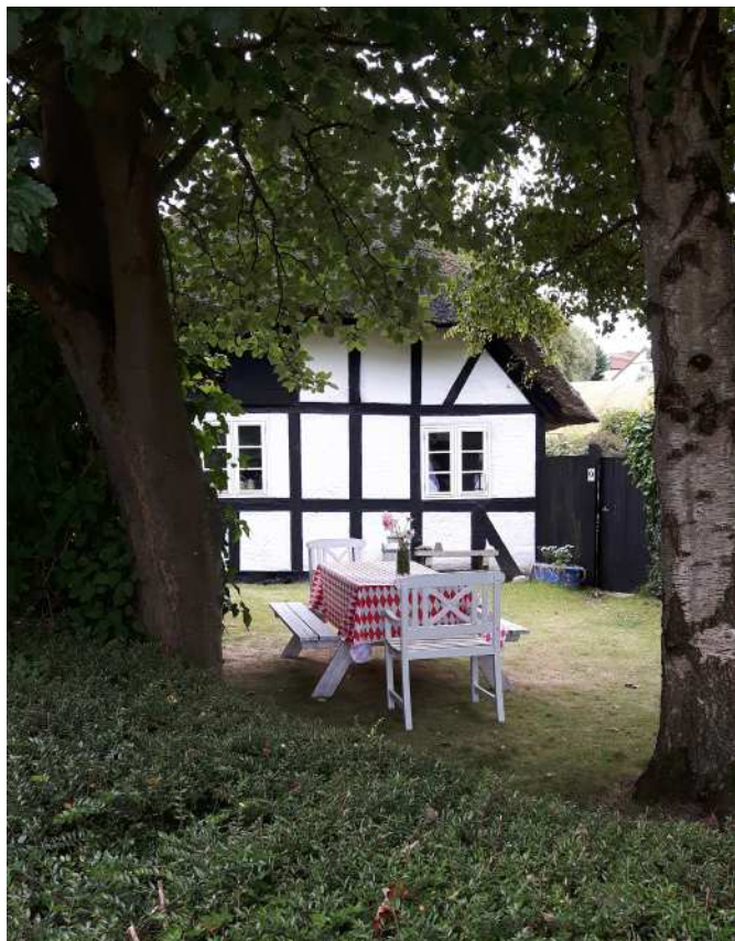
Lyø har en stærk identitet. De mange sort-hvide bindingsværksejendomme hvor tavlerne er streget op med blå langs bindingsværket giver et samlet udtryk, trods variation i form og størrelser i øvrigt.