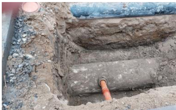
Klargøring af strømpeforing.

Da det er udbedring af gamle og dårlige kloakker, der har den største effekt på antallet af rotterne i kloakken og de afledte problemer på overfladen, er det her Myn-