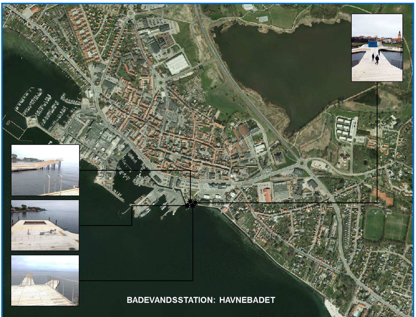
Figur 1. Badestedets placering med billeder taget på badestedet i marts 2014.